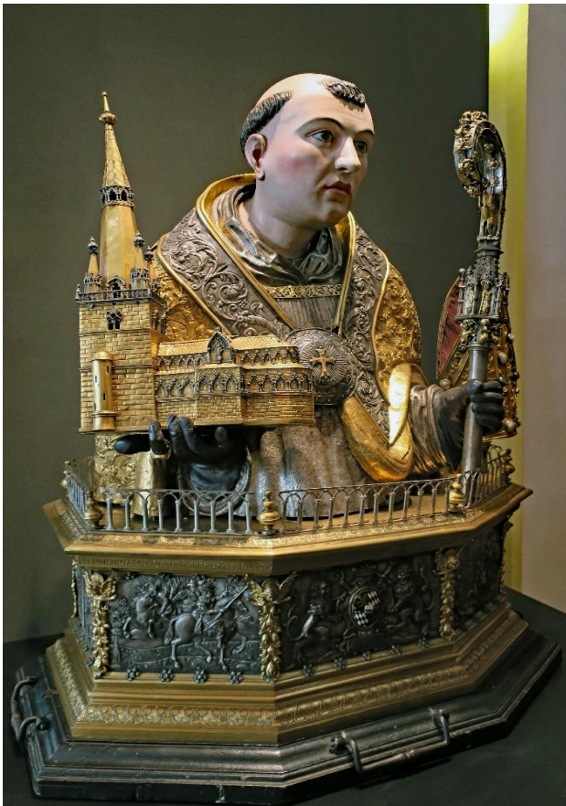
Afb4.; Reliekhouders van Poppo van Stavelot uit 1626. Kerk van Sint-Sebastiaan, Stavelot.