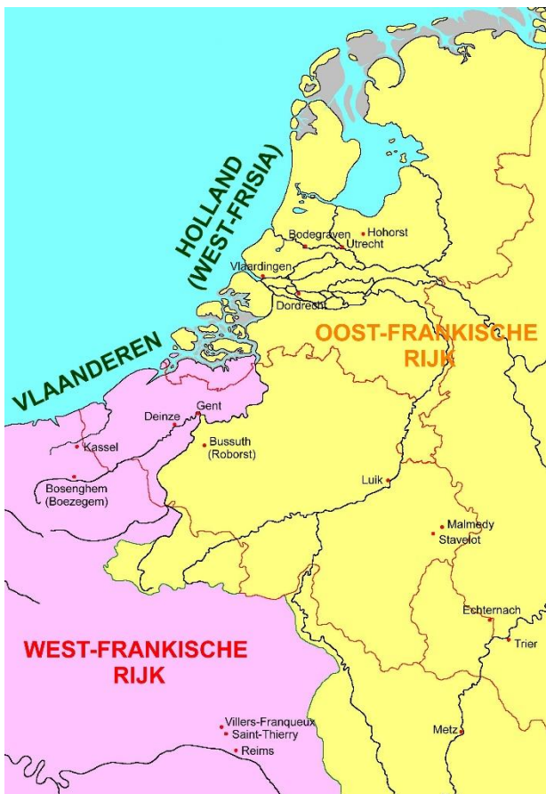
Afb.2; Vlaanderen en Holland rond het jaar 1000, met de in de tekst genoemde plaatsen.